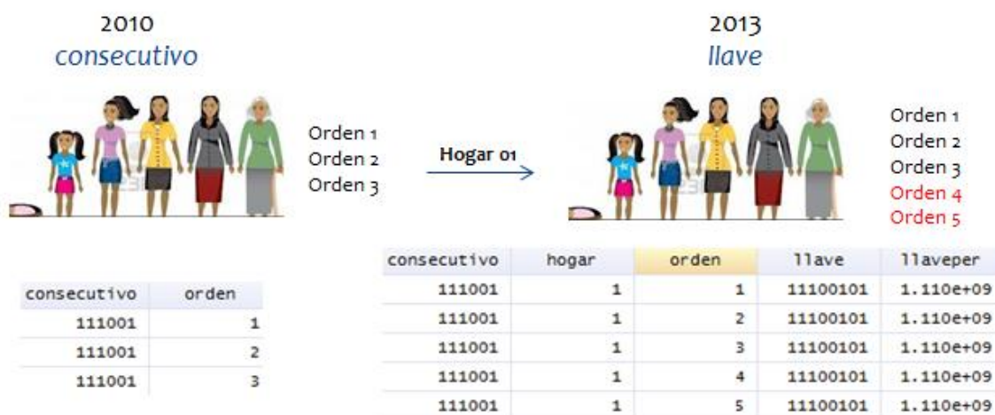
Figura 1. Hogar que no se divide

Hogares que se dividen: Para los hogares que se dividen se debe usar el identificador de llave que está compuesto por consecutivo y hogar . En este caso, se debe tener en cuenta que la variable consecutivo es igual a la de 2010. En la Figura 2 se puede observar un hogar que se dividió. En el primer hogar se mantuvo la persona de seguimiento con orden 1 en 2010, mientras que en el segundo hogar se mantuvieron las personas de seguimiento con orden 2 y 3 en 2010.